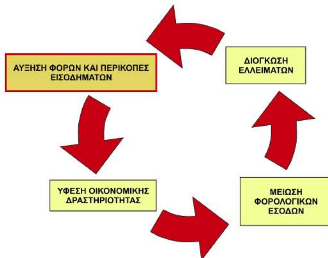
Διάγραμμα 1: Ο «φαύλος κύκλος» της ελληνικής οικονομίας

η λογία ακολουθούν ύφεση της οικονομικής δραστηριότητας, και, εφόσον δεν εφαρμοστούν άμεσα αποτελεσματικά, αντισταθμιστικού χαρακτήρα, μέτρα, μείωση των φορολογικών εσόδων, αύξηση των ελλειμμάτων και τελικά επανεμφάνιση της ανάγκης για επιβολή νέων πρόσθετων φόρων.